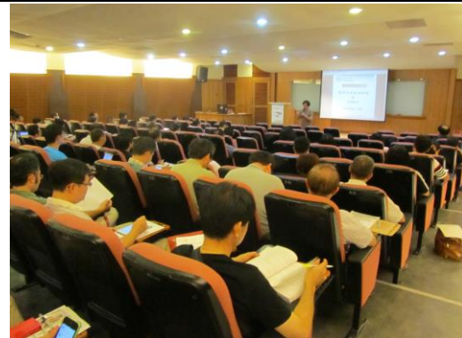
輔導原理與班級經營之上課情形